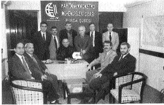
Ö.D.R Bursa İl Örgütü Odamızı Ziyaret Etti:

Önerilerimizin tamamına yakını kabul görmüş ve bundan böyle kentsel doğruları üretmede fikir alışverişinde bulunulmasının yararlarına dikkat çekilerek, böyle dostça ziyaretlerin daha sık tekrarlanması istenmiştir.