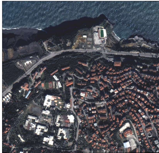
Şekil 1: Test alanının İkonos pan-sharpened görüntüsü

I. görüntü Temmuz 2002' de alınmışken, II. görüntü Ekim 2002' de çekilmiştir. Bu görüntüler, yeryüzünde hemen hemen aynı alanı kaplamış olup, çalışılan II. görüntünün bir bölümü Şekil 1'de gösterilmiştir. Ortalama 450m yüksekliğe sahip ve yaklaşık 11x11 km'lik bir alanı kaplayan İkonos görüntüsünün üst kısımlarında Karadeniz sahili uzanmakta ve bu görüntünün diğer kısımlarında Zonguldak'ın merkezi yerleşimi bulunmaktadır. Görüntüler, ilk alındığı zaman, düzenli bir şekilde yayılmış uygun YKN (yer kontrol noktası) seçimi için analiz edilmiştir. Bu belirleme sonucunda, 43 farklı YKN GPS ölçmeleri ile yaklaşık 3cm doğrulukla ölçülmüştür. Bu noktaların görüntü üzerinde çok iyi görülebilir olmasından dolayı, noktalar, bina köşeleri, kavşaklar vb. olarak seçilmiştir. İkonos görüntüsünün yüksek çözünürlüğünden dolayı, birçok kültürel özellikler tanınmış ve YKN olarak kullanılmıştır. YKN' nın görüntü koordinatlarının ölçülmesi, PCI Geomatica-Orto Engine yazılımının YKN Ölçme Arayüzü (GCP Collection Tool) ile gerçekleştirilmiştir (Büyüksalih, 2003).